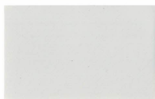
Gris Claro RAL 7035